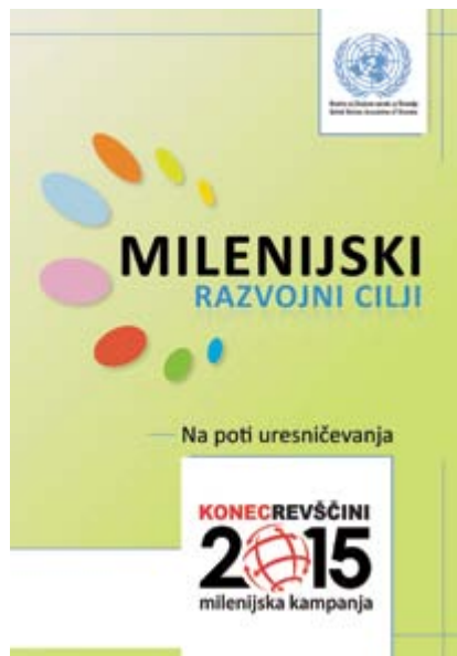
Naslovnica druge izdaje brošure Milenijski razvojni cilji – na poti uresničevanja.