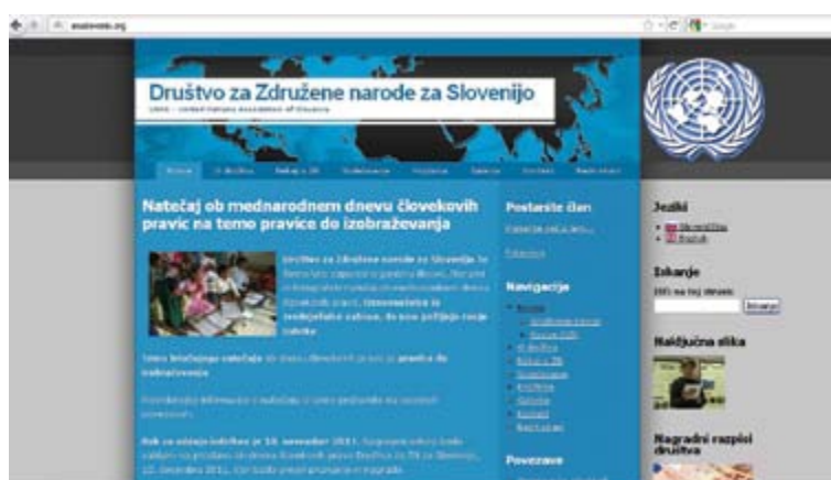
Spletna stran društva.

Obisk knjižnice je danes veliko skromnejši kot v preteklosti. Največji problem knjižnice je, da ni vključena v bibliografski sistem Cobiss , kar prispeva k njeni manjši vidnosti, manjši obisk pa je tudi posledica dejstva, da je mogoče do mnogih publikacij ZN dostopati preko svetovnega spleta.