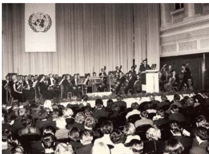
Govor dr. Aleša Beblerja na proslavi ob 20-letnici ZN v Slovenski filharmoniji leta 1965.

Umetniško najbolj dovršena je bila proslava ob dvajsetletnici sprejetja Splošne deklaracije človekovih pravic. Na proslavi, organizirani v ljubljanski Operi, so sodelovali najboljši slovenski dramski umetniki, govorec pa je bil tedanji predsednik Izvršnega sveta Slovenije Stane Kavčič.