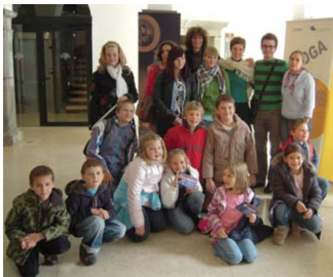
Dogodek »Vstani in ukrepaj« 2009 v Mestnem muzeju Ljubljana.