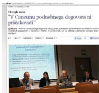
Novica o okrogli mizi »Možnost za napredek na podnebnih pogajanjih v Cancunu« na spletnem portalu Šiol.

Društvo si prizadeva za večjo prepoznavnost svoje vloge kot akterja civilne družbe in z obveščanjem množičnih medijev javnost redno seznanja z društvenimi aktivnostmi in dogodki. V letu 2010 je prostovoljka Maja Knez pripravila celostno grafično podobo društva, ki med drugim vključuje številne promocijske materiale društva.