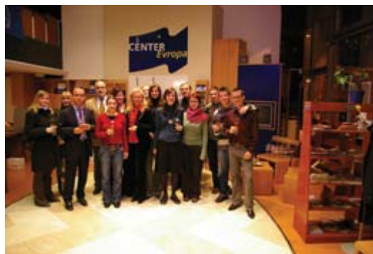
Prostovoljci društva na okrogli mizi ob dnevu človekovih pravic 2006.