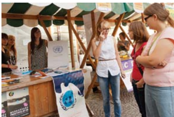
Stojnica društva na Bazarju nevladnih organizacij leta 2011.

V letih 2009, 2010 in 2011 je društvo sodelovalo na Bazarju nevladnih organizacij, dogodku, ki ga CNVOS tradicionalno organizira v okviru jesenskega Festivala slovenskih nevladnih organizacij LUPA. Društvo se je na festivalu predstavljalo s svojo stojnico, na kateri so si lahko obiskovalci ogledali številno strokovno literaturo in pridobili informacije o delovanju in aktivnostih društva. Leta 2011 je društvo svojo stojnico tematsko obarvalo, saj je bila organizirana ob mednarodnem dnevu demokracije, in z mimoidočimi debatiralo o demokraciji ter delilo poslanico generalnega sekretarja ZN ob mednarodnem dnevu demokracije.