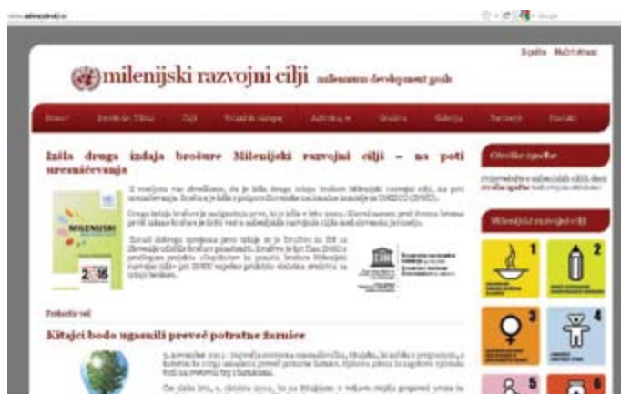
Tematska spletna stran o milenijskih razvojnih ciljih.

Društvo je v sklopu Milenijske kampanje ZN leta 2009 vzpostavilo novo tematsko spletno stran o milenijskih razvojnih ciljih, ki se nahaja na naslovu www.milenijski-cilji.si . Na strani je moč najti podrobne opise ciljev, opis kampanje ZN »Vstani in ukrepaj«, predloge za udejstvovanje, seznam priporočenega branja, galerije slik, milenijske otroške zgodbe, nagrajene na dveh literarnih natečajih društva, ter novice s področja uresničevanja milenijskih razvojnih ciljev.