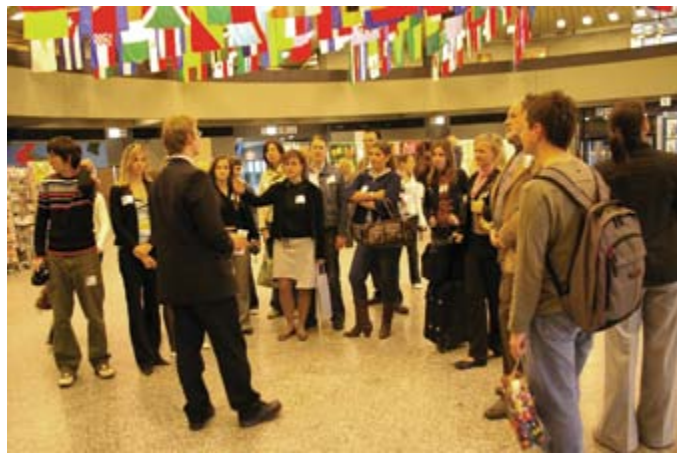
Strokovna ekskurzija na Dunaj leta 2007.

Z uvedbo prostovoljstva v letu 2006 je začelo društvo izvajati ekskurzije na sedeže ZN. Aprila 2007 so prostovoljci organizirali strokovno ekskurzijo na Dunaj, marca 2008 in aprila 2011 pa v Ženevo.