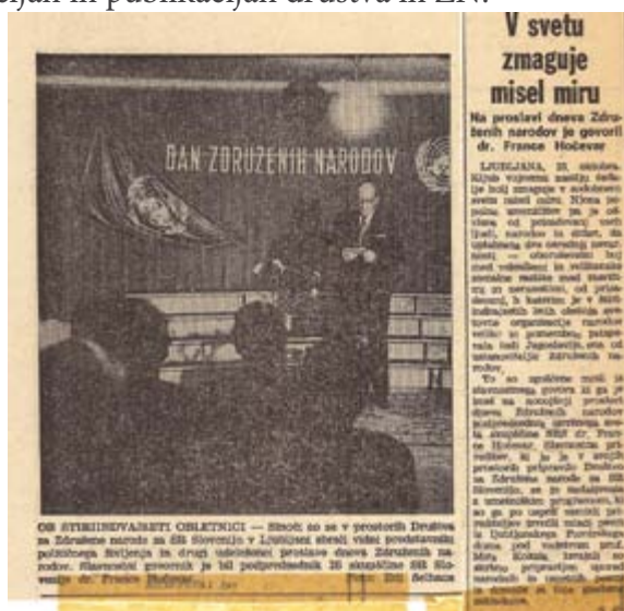
Novica o obeleženju 24-letnice ZN v časopisu Delo leta 1969.

Društvo je o svojih dejavnostih redno obveščalo medije, predvsem redakcije časopisov Delo, Dolenjski list, Naši razgledi in Večer. V omenjenih časopisih je bilo tako objavljenih več člankov in prispevkov o pomembnih obletnicah, akcijah in publikacijah društva in ZN.