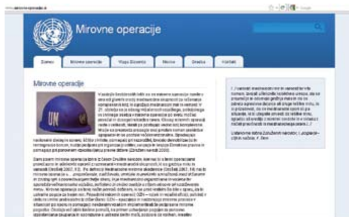
Tematska spletna stran o mirovni operacijah.

Leta 2011 so člani društva v sodelovanju s Katedro za obramboslovje na Fakulteti za družbene vede Univerze v Ljubljani na naslovu www.mirovne-operacije.si vzpostavili spletno stran o mirovni operacijah. Spletna stran vsebuje opredelitev mirovni operacij in opredeljuje vlogo Slovenije, na strani pa so objavljena tudi gradiva o operacijah.